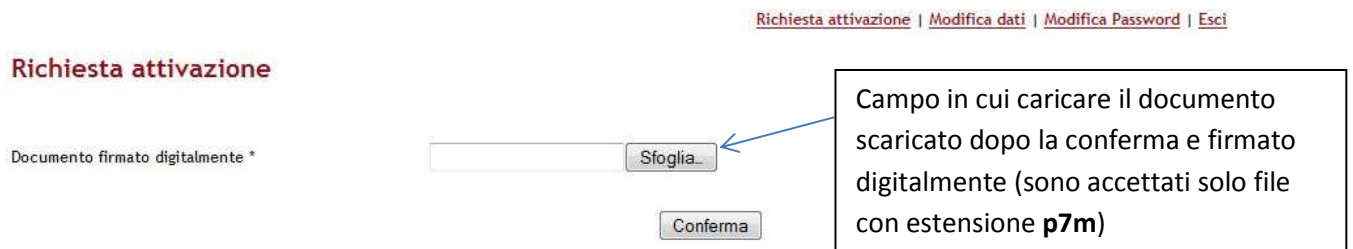
Fig. 5: Pagina attivazione

Alla fine dell'attivazione il referente dell'impresa riceverà un'email di conferma dell'avvenuta attivazione.